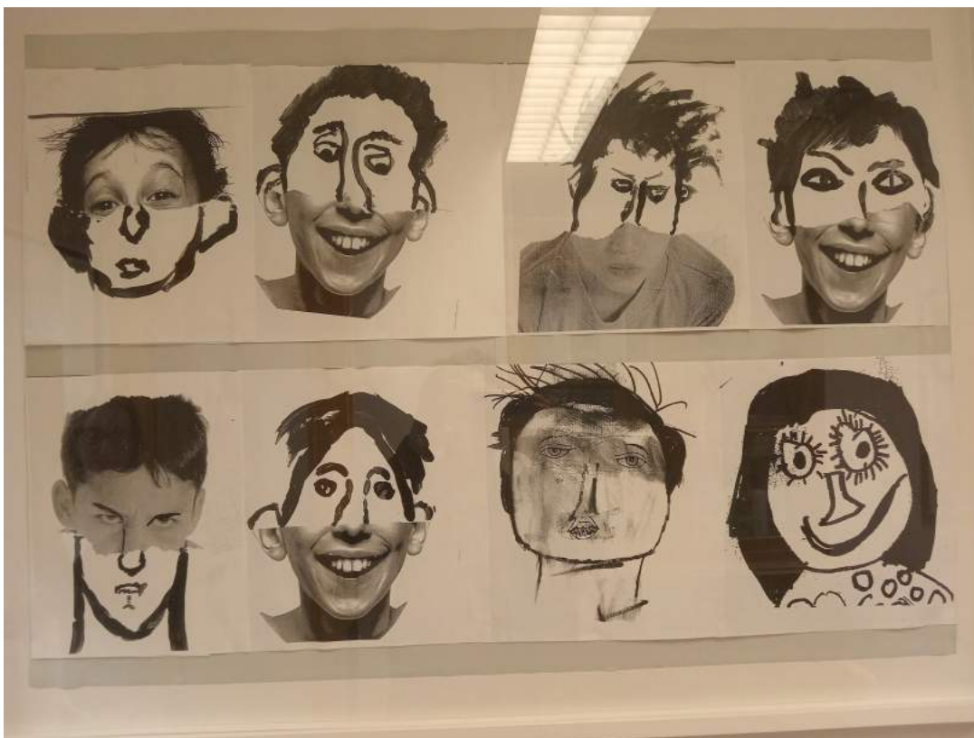
Photo d'un des nombreux dessins réalisés avec les enfants affichés, au sein du service.